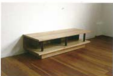
ホワイトオークのTVボード (REAL WOOD)