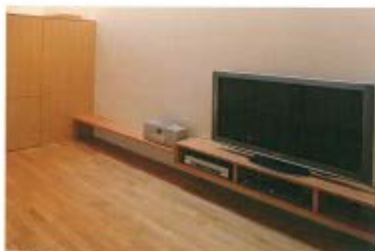
レッドオークのTVボード (土間のある家/濱田建築事務所)